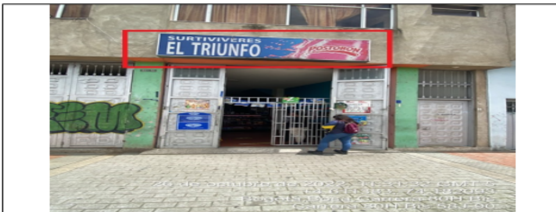
En la cual se evidencia un elemento tipo aviso en fachada perteneciente al establecimiento comercial denominado TIENDA SURTIVIVERES EL TRIUNFO , el cual se encuentra ubicado en antepecho de segundo piso, y al momento de la visita se encontraba instalado sin el registro ante la SDA.