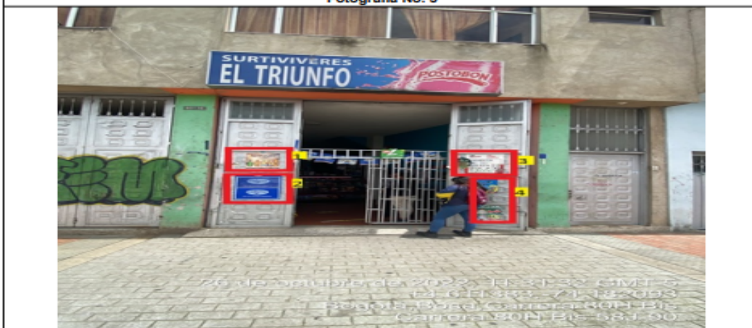
En la cual se evidencian cuatro (4) elementos PEV pertenecientes al establecimiento comercial denominado TIENDA SURTIVIVERES EL TRIUNFO , los cuales son adicionales al único elemento permitido.